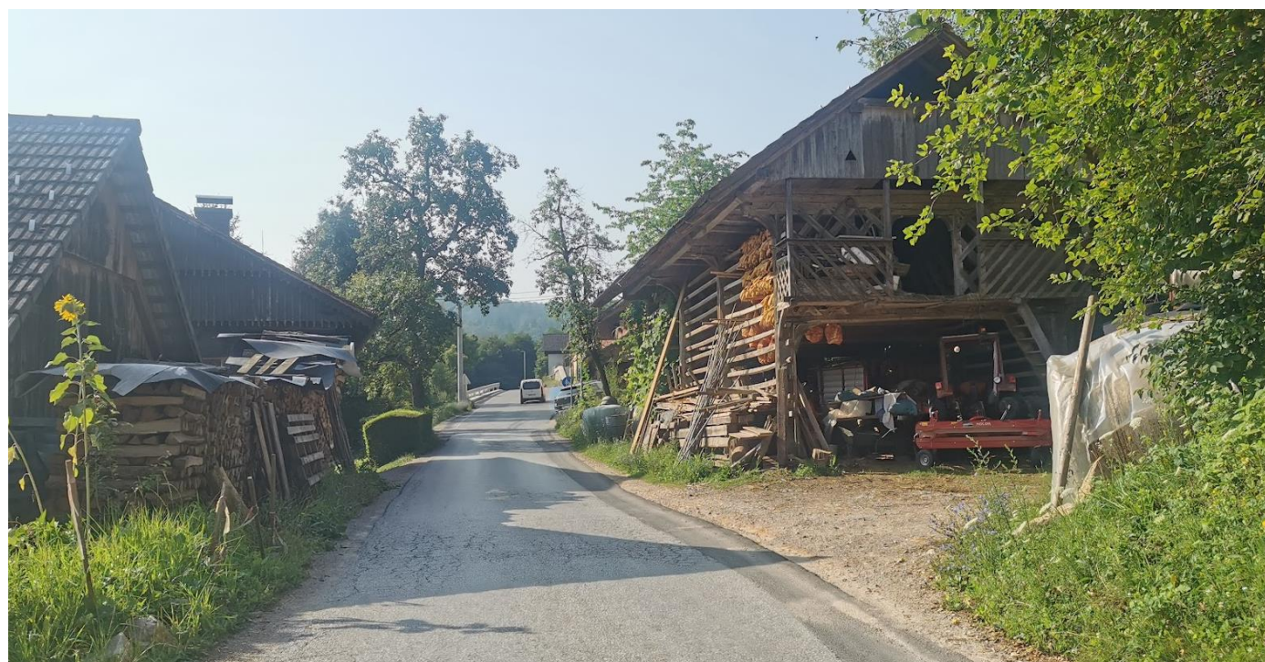
Pogled s severa po lokalni cesti; na levi kmetija, na desni kozolec