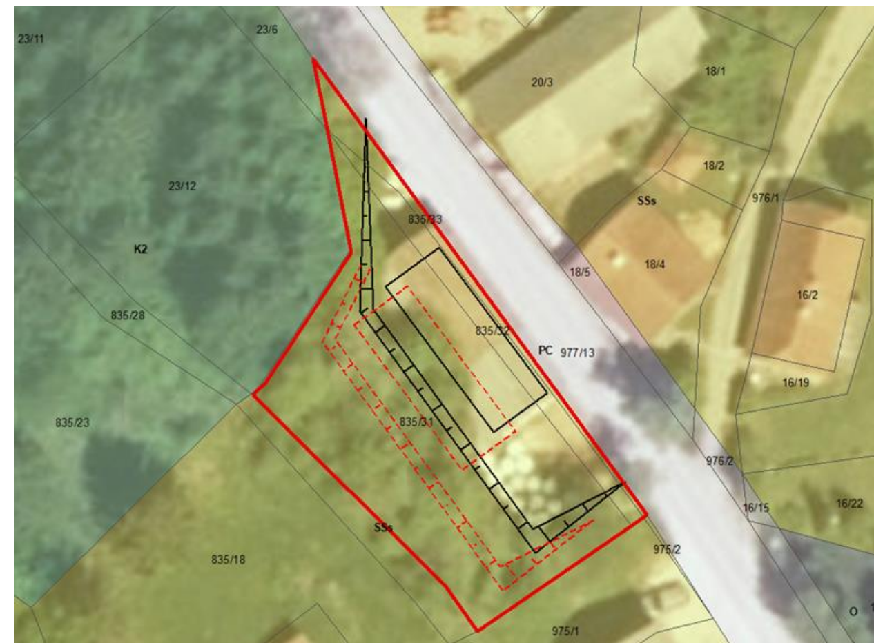
Prikaz predvidenega premika kozolca na izseku iz namenske rabe prostora v OPN Ivančna Gorica (črne linije: obstoječi kozolec z okoliškimi brežinami, rdeče: predlagani premik kozolca in povezanih ureditev)